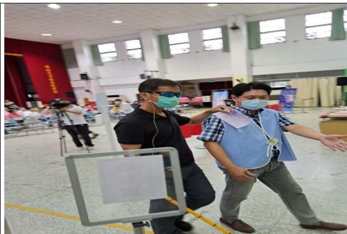
說明：協助、引導視障者進行投票