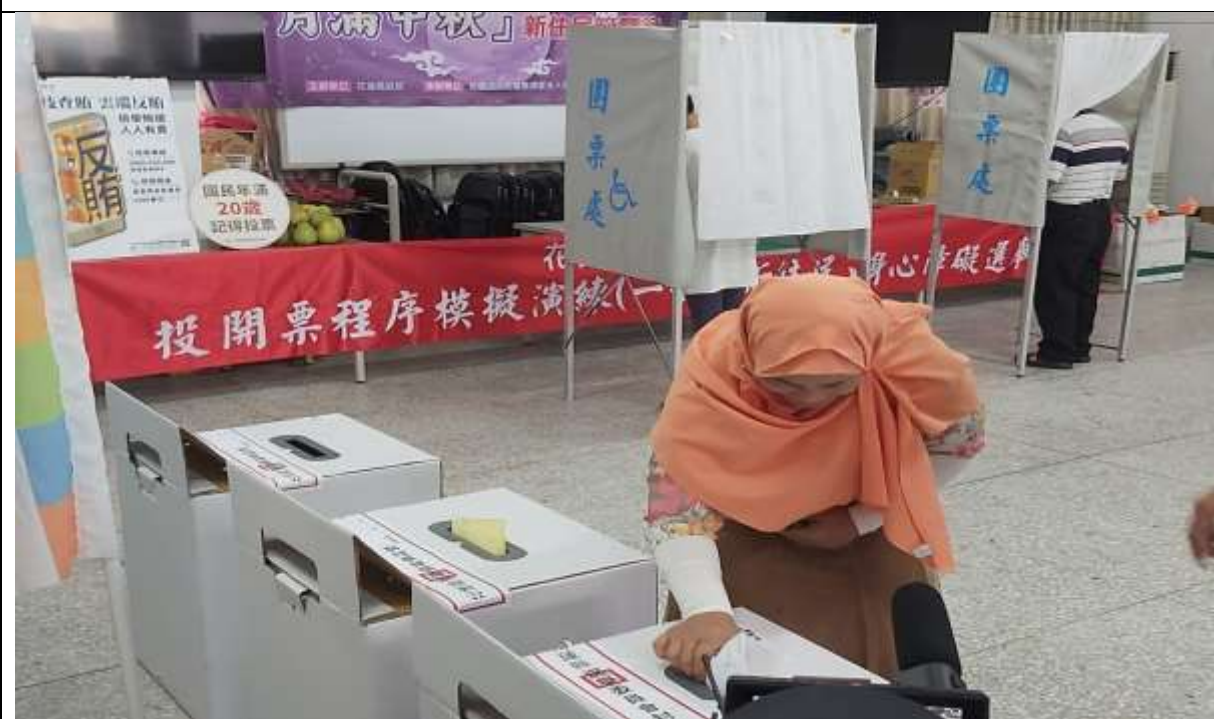
說明：新住民進行模擬投票演練