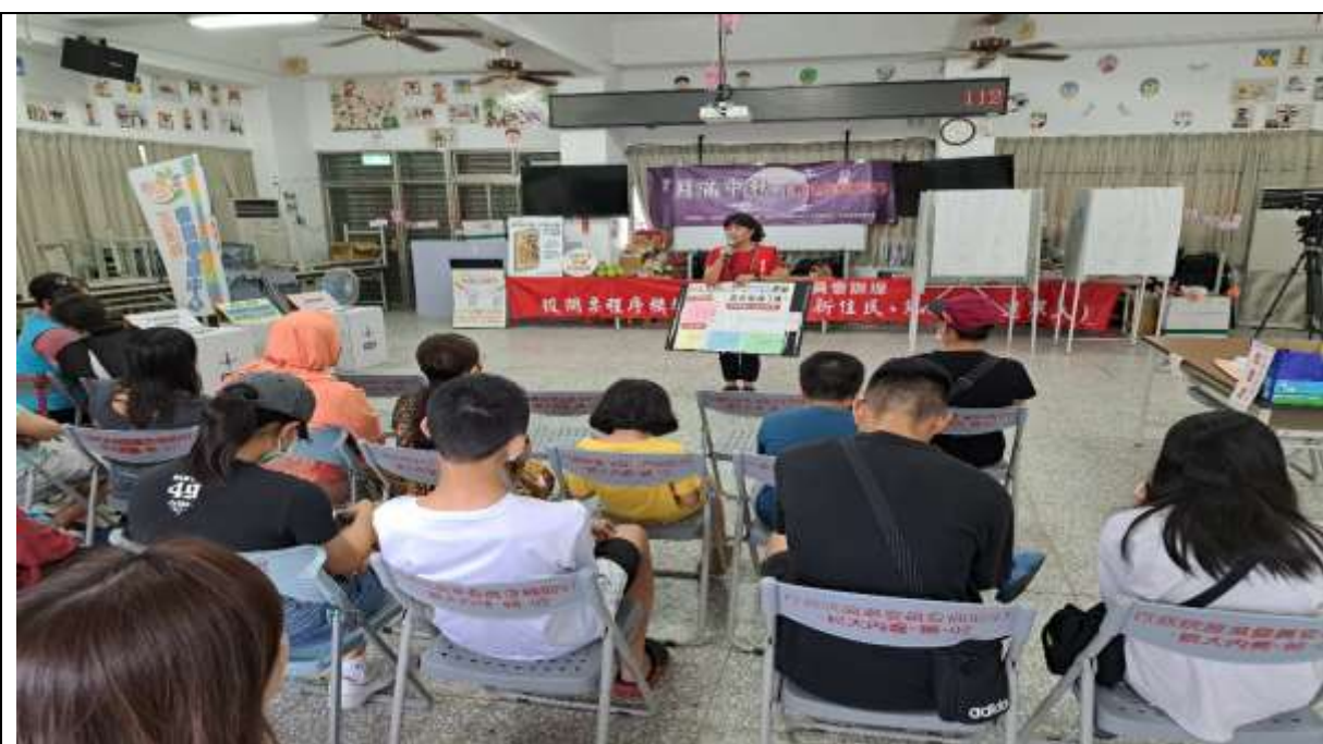
說明：新住民投票模擬演練前說明、講解及介紹