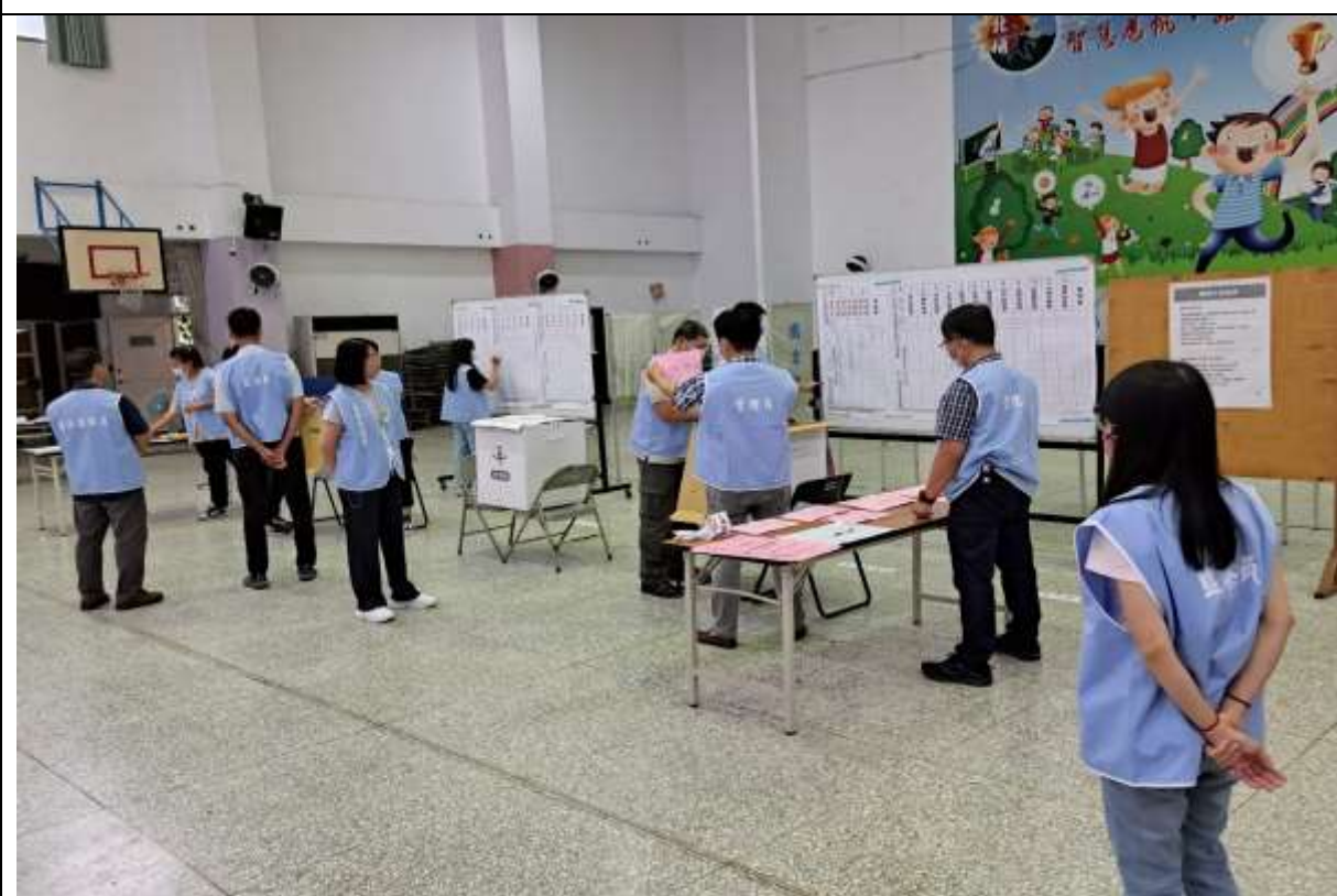
說明：演練二組開票作業